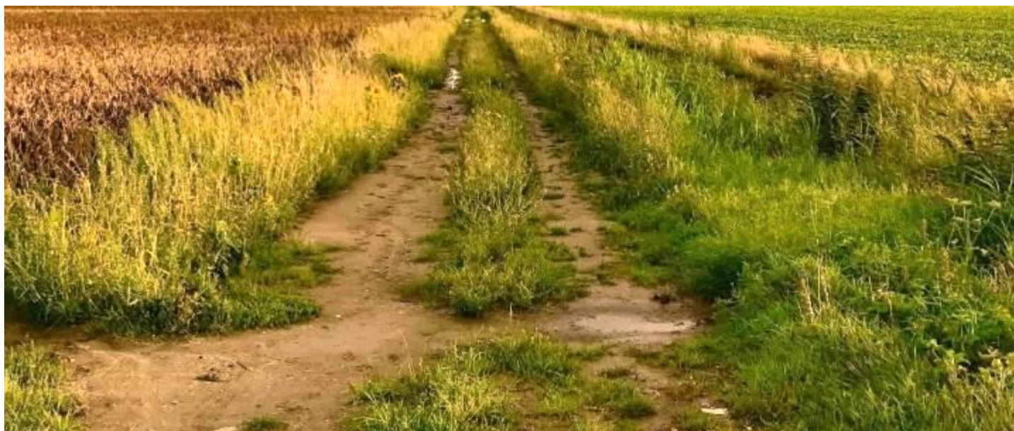
Afbeelding akkerrand te veel doorheen gereden